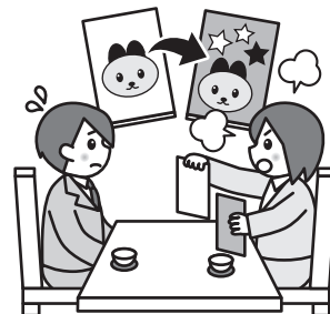
パンフレットで使用したイラストが著作権を侵害したとして訴えられた。