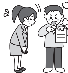
ケアプランの作成ミスでサービス利用者の自己負担額が大きくなり、賠償請求を受けた。

業務上相当な注意を用いずに行った行為(不作為を含みます。)に起因して、利用者に財産的損害を与えたことについて、保険期間中に行われた損害賠償請求につき、被保険者が法律上の損害賠償責任を負担することによって被る損害を補償します。